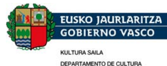
KULTURA SAILA DEPARTAMENTO DE CULTURA